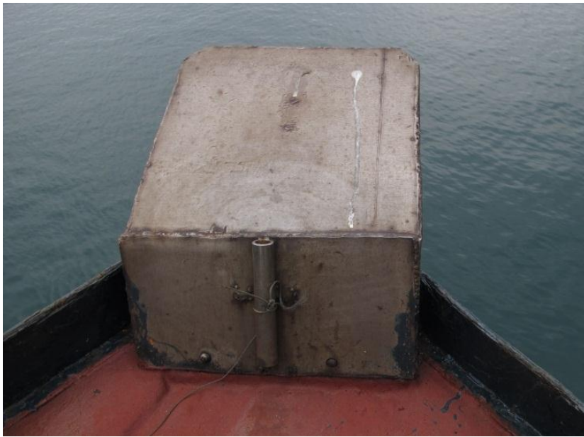
圖 4 - 船艙的不銹鋼箱