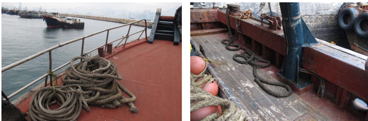
圖 3 - 漁船船邊圍欄和圍板