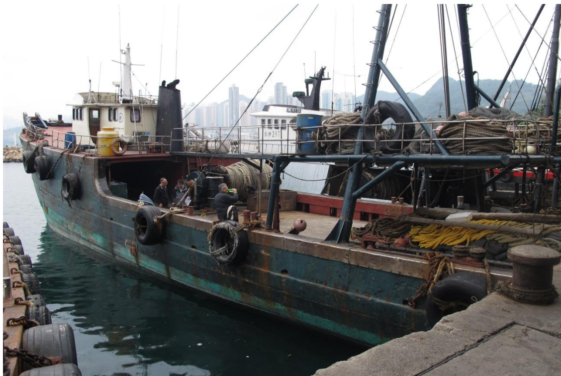
漁船 CM63515A 的外貌（拍攝時船隻已經不在事故發生時的位置）