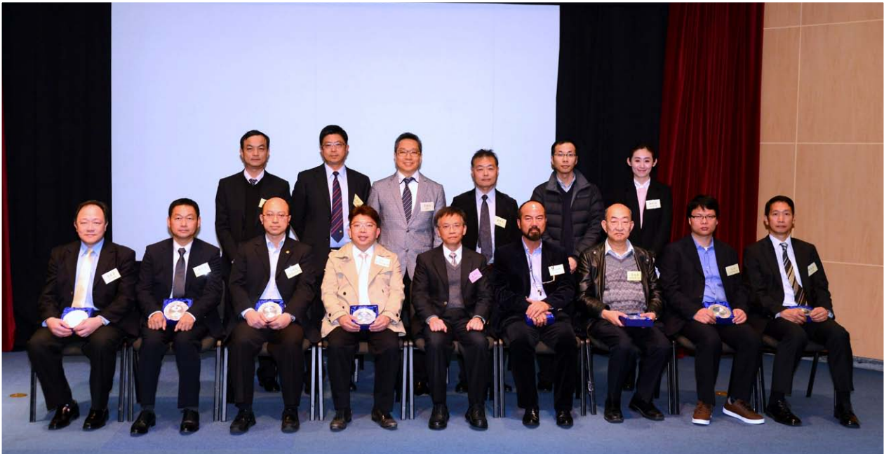
海事處副處長童漢明（前排中）在研討會上與嘉賓合照。他提醒船長和船隻負責人，在霧季航行時須加強瞭望，以安全速度行駛。

海事處於 1 月 26 日舉行「2015 年海上航行安全研討會」，提醒船長和船隻負責人，當霧季海面能見度欠佳時，除加強瞭望外，亦要以安全速度行駛，並嚴格遵守國際海上避碰規則。