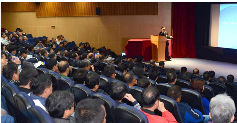
超過 160 位航運界代表、本地船隻船長及操作員、海事工程代表出席研討會。

有關在能見度欠佳情況下的航行安全，處方已發出相關的海事處布告 2015 年第 5 號，並已上載海事處網頁 ( www.mardep.gov.hk )。