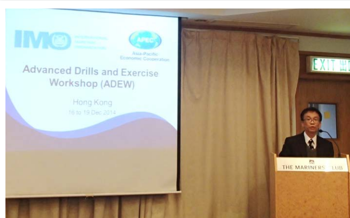
海事處副處長童漢明於進階海事演練工作坊上致開幕辭。

工作坊內容涵括演練概念，演練和通訊規劃，以及在經驗豐富的導師指導下進行桌面演習。學習重點包括資源管理，特別是保安級別提高後推行措施的資源管理、保安事宜的詳細描述，以及傳媒應對技巧，供參加者於日後的保安演練中應用。🌊