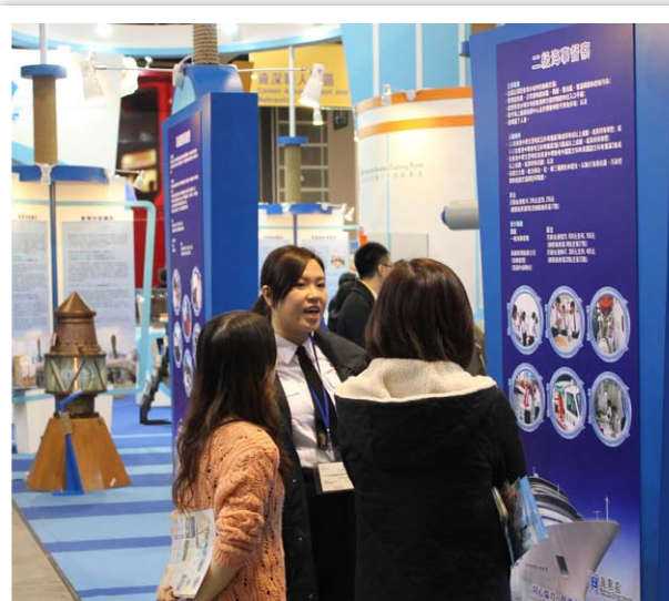
海事處人員在場解答參觀者的查詢。

香港航運發展局亦舉辦兩場講座，邀請業界人士分享入行及晉升歷程、工作苦樂及進修之路。