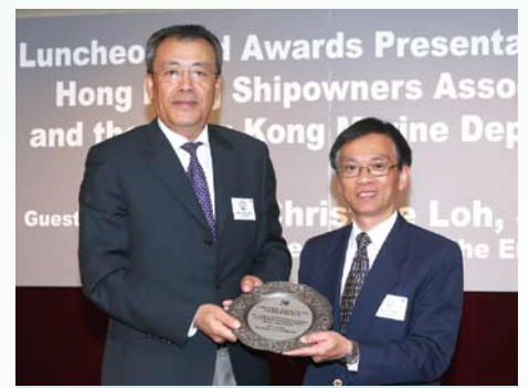
海事處副處長童漢明(右)向中遠(香港)航運有限公司頒發於香港船舶註冊擁有最高總噸的獎項。該公司亦獲頒發港口國監督檢查卓越表現獎。