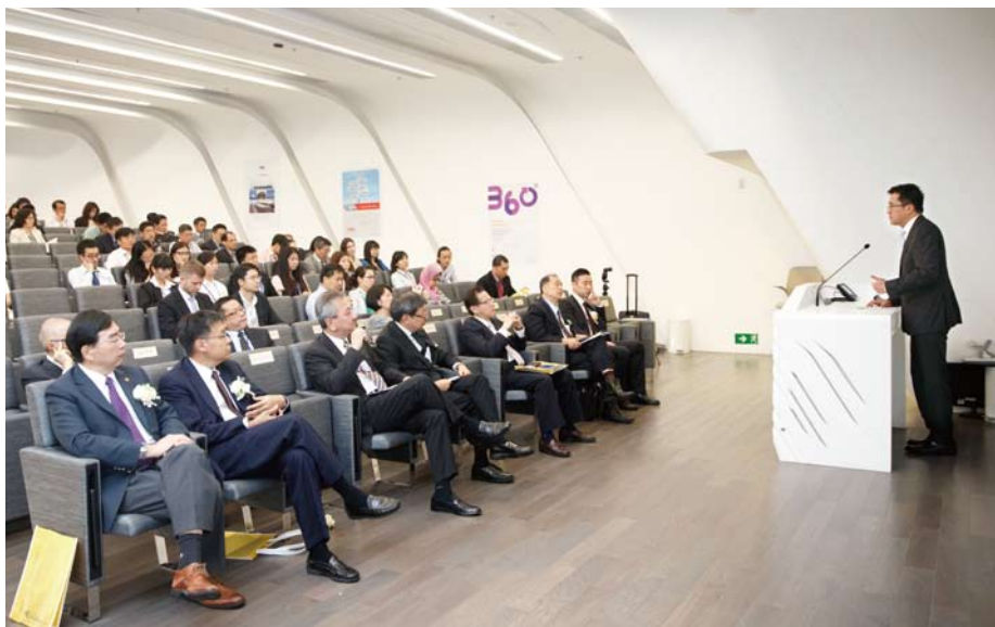
海事處處長黃偉綸向與會者簡介香港港口的優勢及海事處的職能。

航運、港口及機場國際論壇為年度國際會議，由董浩雲國際海事研究中心和香港理工大學物流及航運學系合辦，讓學者和業界人士交流國際航運及航空事宜，推動行業發展和相關的學術研究。今年會議共有超過120人參與。