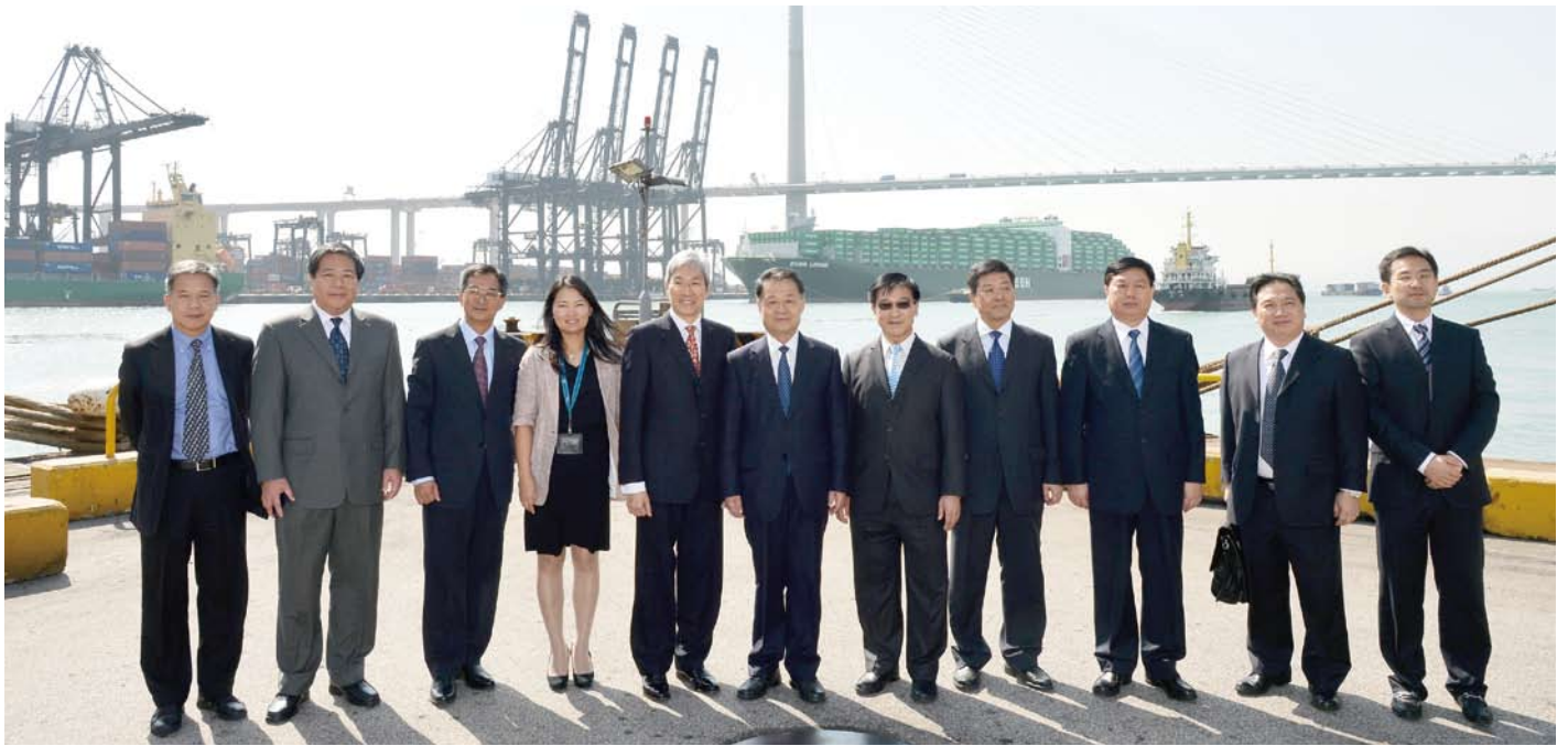
代表團參觀葵青貨櫃碼頭。