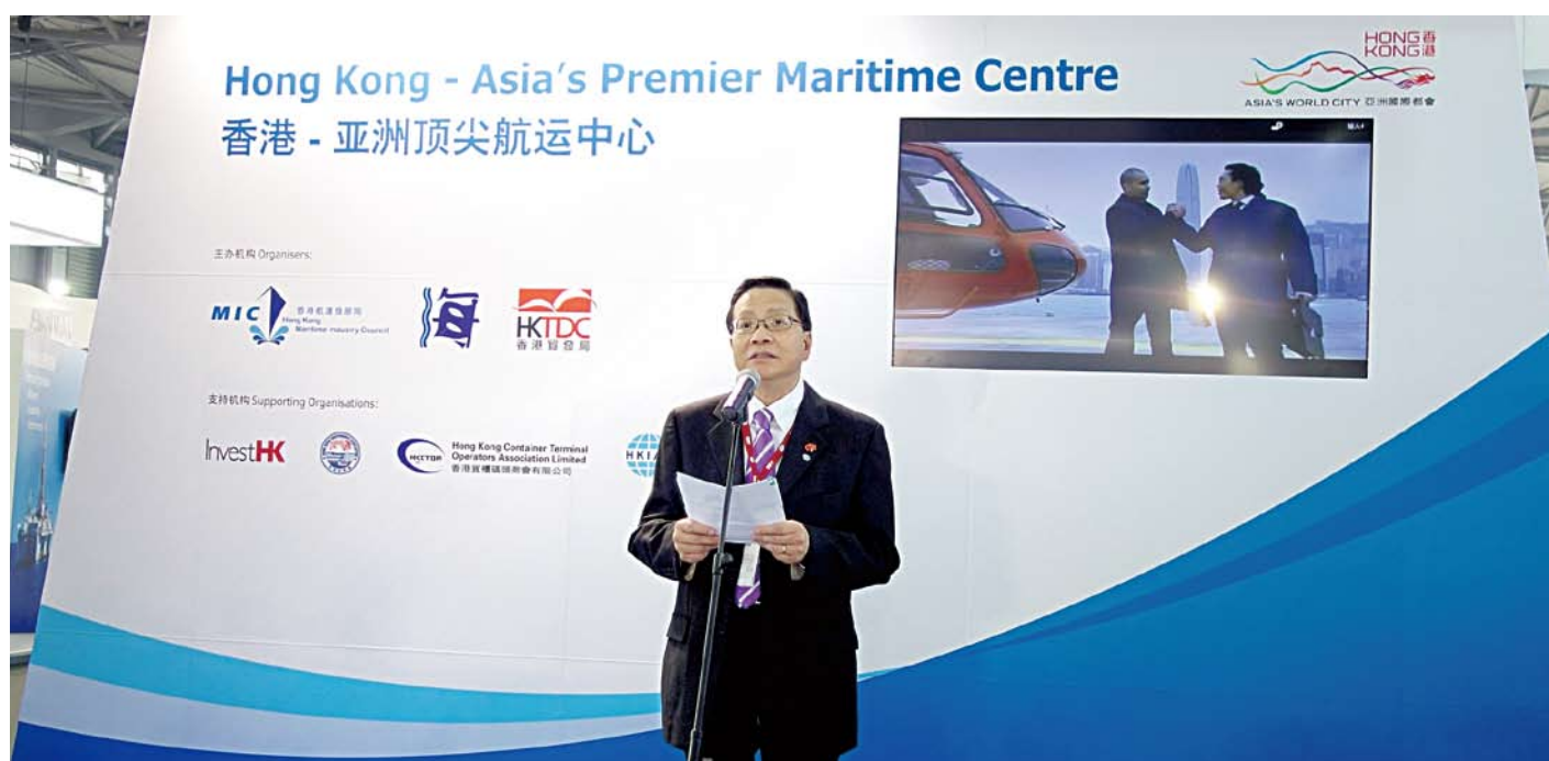
運輸及房屋局局長張炳良教授在2013年中國國際海事會展香港館開幕典禮上致辭。

香港館由香港航運發展局聯同海事處和香港貿易發展局設立，以宣傳香港實力雄厚的航運業群。館內有九個香港參展商，展示先進的航海及通訊設備，以及氣象導航、船舶維修、海上資產追蹤、船隊管理等服務，藉此推廣香港港口與全面的航運服務。🌊