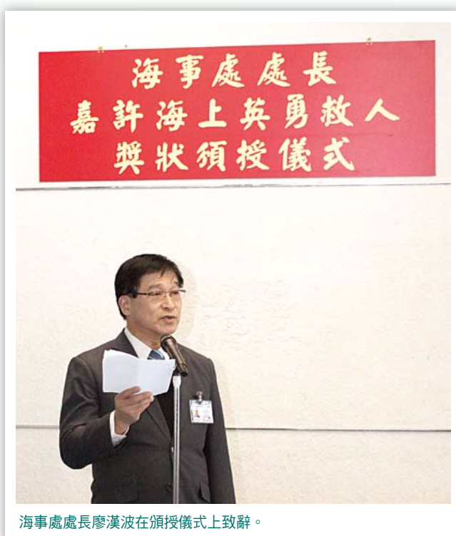
海事處處長廖漢波在頒授儀式上致辭。

廖漢波續說，海上意外總是防不勝防，海事處現正全面檢討有關規管本地載客船隻安全的要求，以提升載客船隻及海上安全；而第一階段的改善措施亦已於11月29日公布。🌊