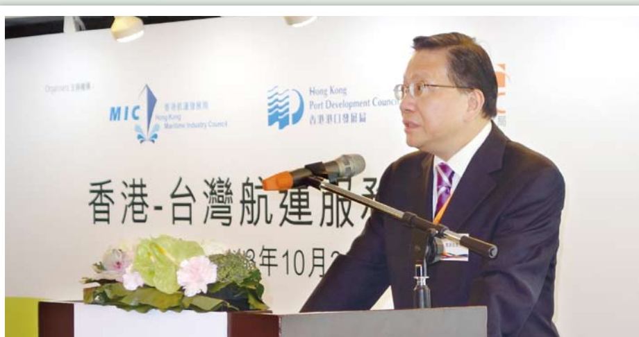
運輸及房屋局局長張炳良教授為「香港—台灣航運服務研討會」主禮。

張炳良教授亦在10月30日為由香港航運發展局、香港港口發展局和香港貿易發展局合辦的「香港—台灣航運服務研討會」主禮。研討會上，張炳良教授向台灣業界推介香港的船舶融資、船舶管理、船舶經紀、海事保險、海事法律及仲裁等多元化服務。