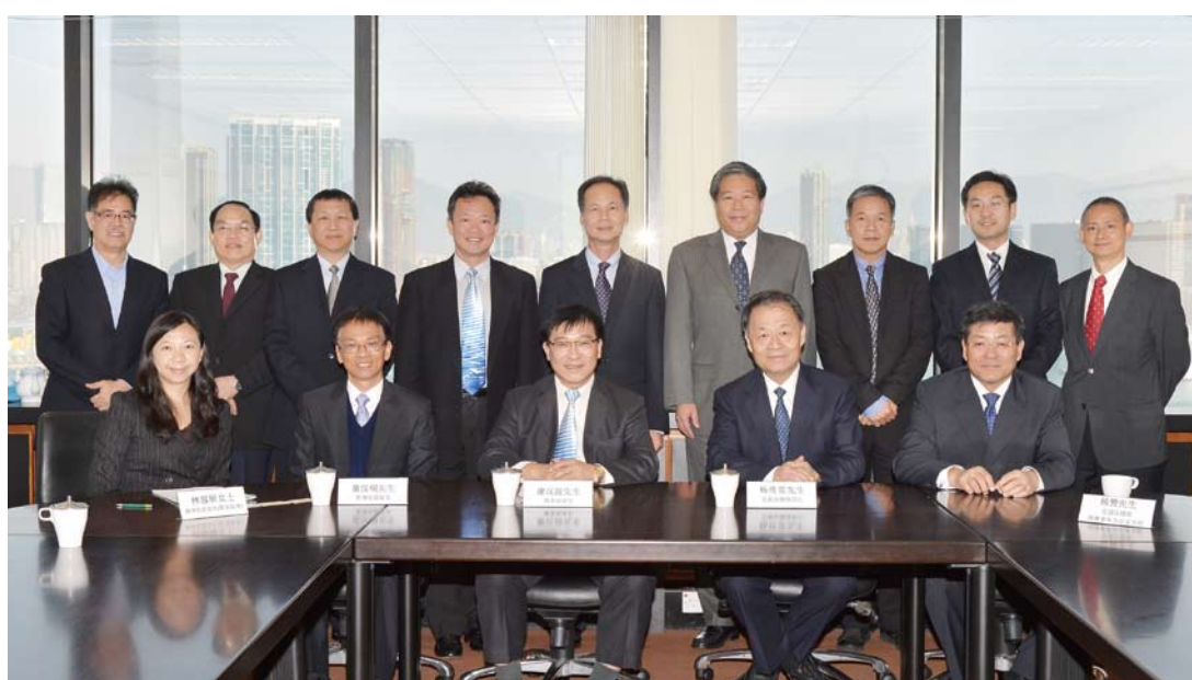
國家交通運輸部部長楊傳堂(前排右二)與海事處處長級人員會面。

楊傳堂亦在廖漢波和助理處長(策劃及海事服務)馮國明的陪同下，參觀葵青貨櫃碼頭。🌊