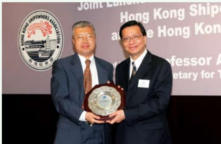
運輸及房屋局局長張炳良教授（右）向中遠（香港）航運有限公司頒發於香港船舶註冊擁有最高總噸的獎項。

張炳良教授及董立新共同頒發「香港海事年度人物」獎予香港海事博物館董事會主席何安達，以表揚他在建設香港海事博物館新館所付出的努力。