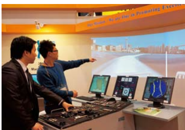
參觀者嘗試在海港內掌舵駕船。

展覽於1月31日至2月3日在香港會議展覽中心舉行，吸引了很多對航運業有興趣的年青人參觀。