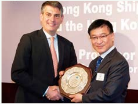
海事處處長廖漢波（右）向Tiger Pisces Limited頒贈獎牌，以標誌該公司旗下船舶為香港船舶註冊跨越8千萬總噸位的界線。