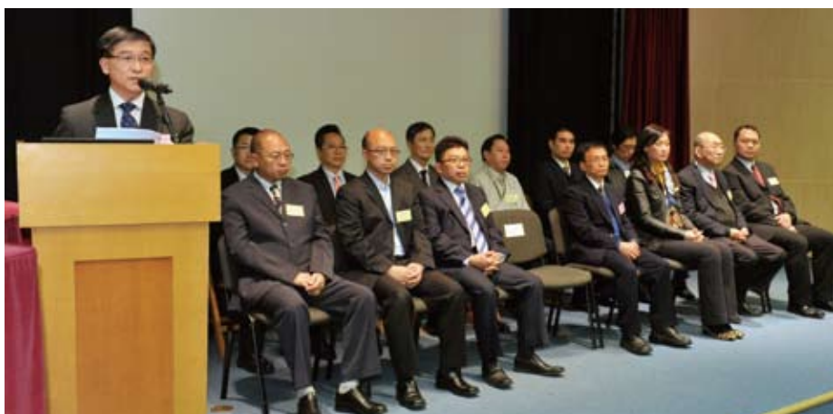
海事處處長廖漢波(左)於香港太空館舉行的「2013年海上航行安全研討會」上致辭。

有關在能見度欠佳情況下的航行安全，處方已發出相關的海事處布告2012年第172號，並已上載海事處網頁（ www.mardep.gov.hk ）。🌊