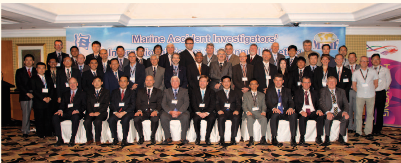
出席「第21屆國際海事調查官論壇」的海事調查人員合照。