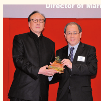
運輸及房屋局常任秘書長(運輸)何宣威(右)向萬利輪船有限公司頒發祥龍管理獎。