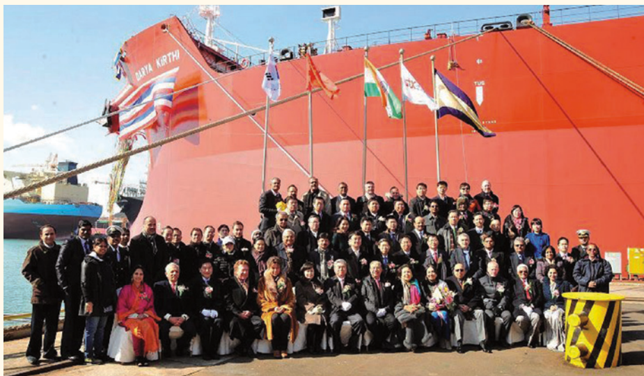
在鎮海出席「大海之譽」號散貨船命名及交付儀式的嘉賓合照。

香港特別行政區政府海事處 香港中環統一碼頭道38號海港政府大樓 香港郵政信箱4155號 查詢電話：(852) 2542 3711 傳真：(852) 2541 7194, 2544 9241 網址：www.mardep.gov.hk 電郵：mdenquiry@mardep.gov.hk