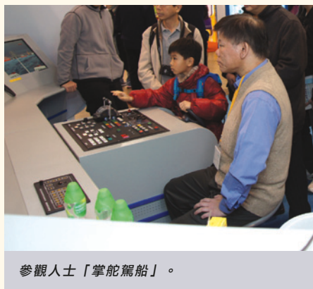
參觀人士「掌舵駕船」。

攤位內的展板提供與聘任相關的資料，包括入職條件、主要職責和薪酬等。同場亦播放了海事主任和驗船主任