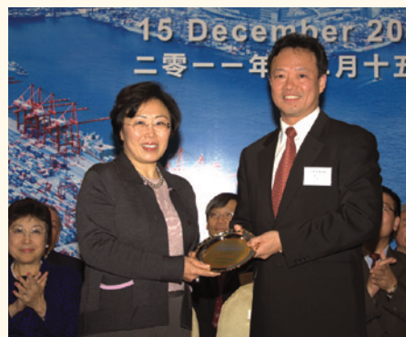
蘇平治(右)向運輸及房屋局局長鄭汝樺致送紀念碟。

出席香港航運界聯席會議成立典禮的包括,運輸及房屋局局長鄭汝樺、立法會議員劉健儀、海事處處長廖漢波、中國全國政協常委梁振英,和新民黨主席葉劉淑儀。