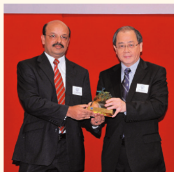
何宣威向Chellaram Shipping (Hong Kong) Ltd 頒發瑞鳳管理獎。