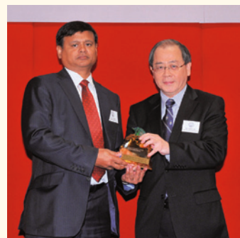
何宣威向Executive Ship Management Pte Ltd頒發金蟾管理獎。