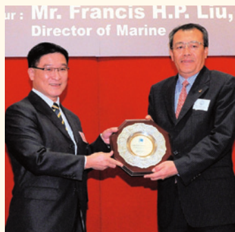
海事處處長廖漢波（左）向中遠（香港）航運有限公司頒發獎項。