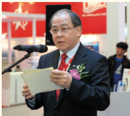
運輸及房屋局常任秘書長（運輸）何宣威。

「2011年中國國際海事會展」為兩年一度的航運貿易盛事，本屆於2011年11月29日至12月2日在上海舉行。香港館是由香港航運發展局聯同香港貿易發展局和海事處設立。由香港航運發展局成員