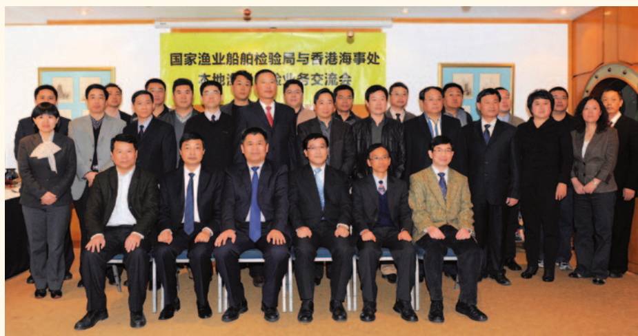
技術交流會與會者合照。

今次是海事處自2007年起委託漁檢局在內地為香港領牌漁船檢驗後，首次舉行同類的交流會。有關的委託安排為香港漁民提供便利及高水平的驗船服務，讓他們以較低的驗船費，確保其漁船符