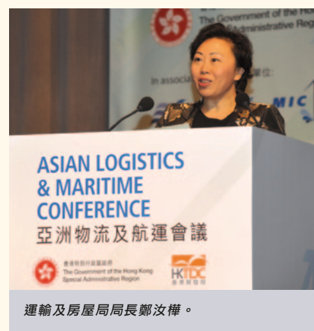
運輸及房屋局局長鄭汝樺。

以「如何利用物流優勢管理業務」、「區域分銷中心的重要性」及「航運業的現在與未來」為主題。