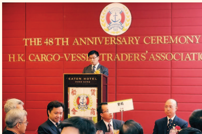
海事處處長廖漢波 在會慶上致辭。

拖曳期間天氣轉變、載荷分布、船員在船上逗留及須穿著救生衣等方面作出指引。海事處促請運沙石躉船及拖船操作人遵從指引，加強操作方面的安全。