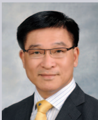
海事處處長廖漢波。