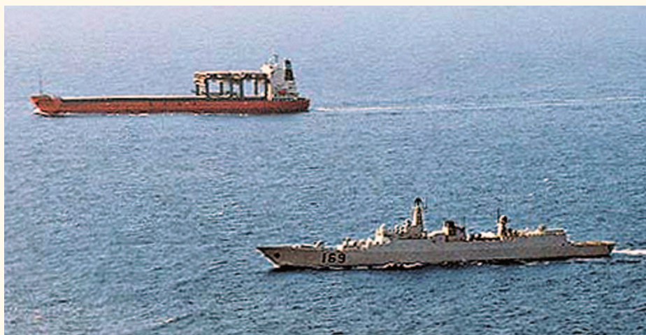
解放軍護航編隊為航經亞丁灣的香港註冊船舶護航。