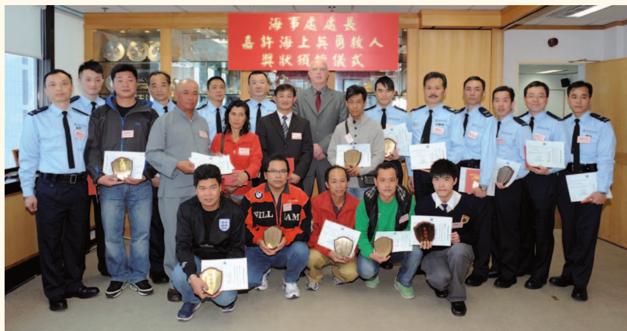
獲嘉許人士與海事處處長譚百樂（後排中）合照。