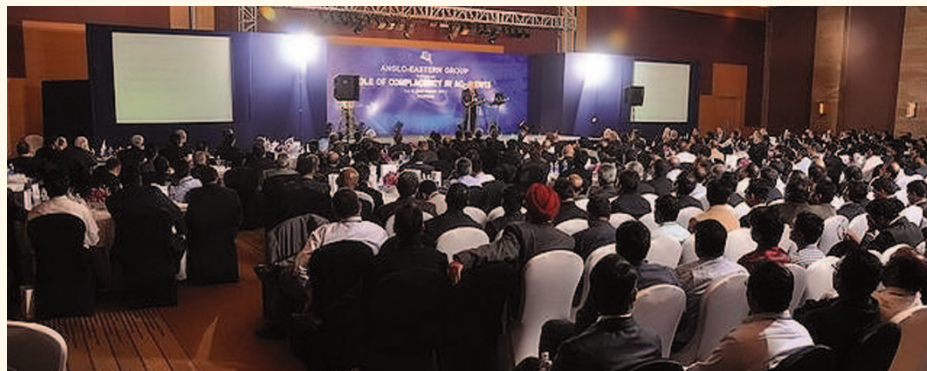
在孟買的海員周年研討會吸引數百位來賓。

為了進一步推廣船隊的安全意識，海事處更特別設立「港口國監督檢查卓越表現獎」，表揚每年在港口國監督檢查中，表現最優異的5間船舶管理公司。