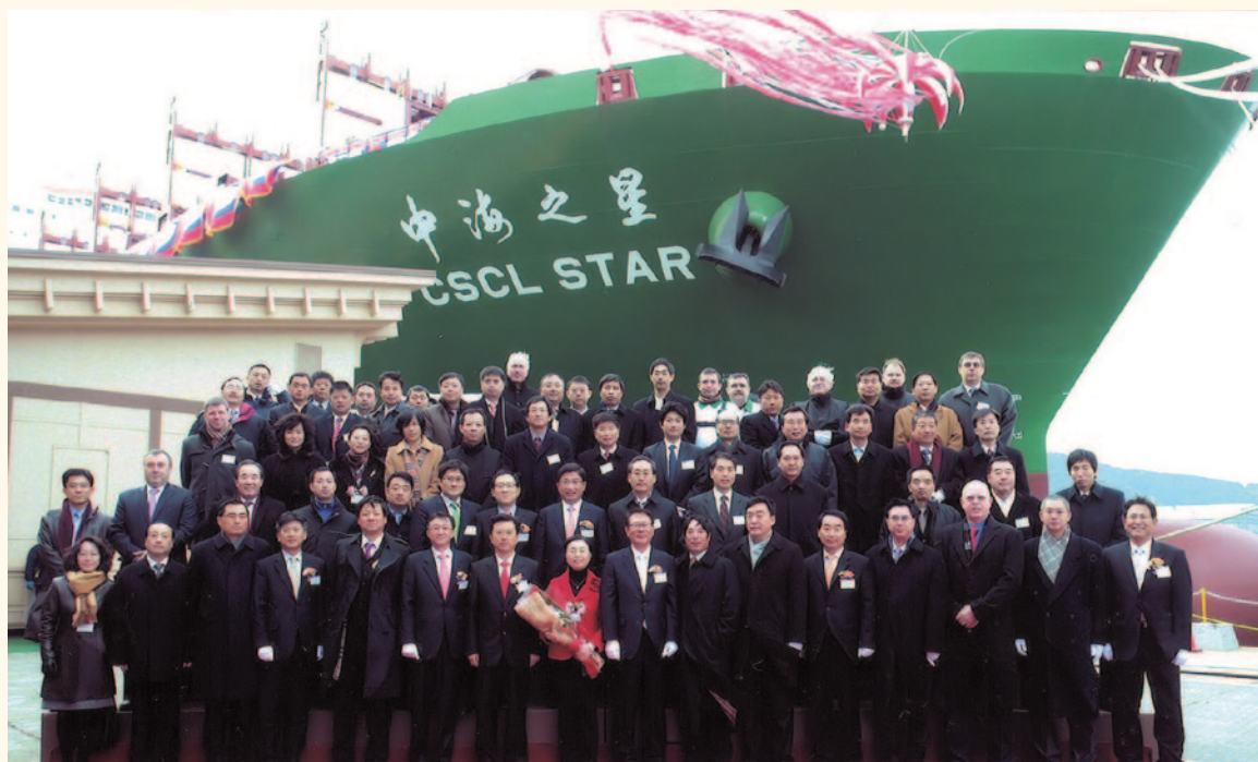
在釜山出席「中海之星」號命名儀式的嘉賓合照。

香港特別行政區政府海事處 香港中環統一碼頭道38號海港政府大樓 香港郵政信箱4155號 查詢電話：(852) 2542 3711 傳真：(852) 2541 7194, 2544 9241 網址：www.mardep.gov.hk 電郵：mdenquiry@mardep.gov.hk