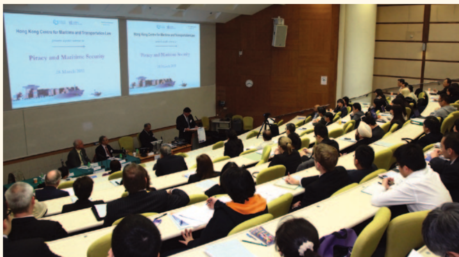
「海盜及海上保安」研討會。