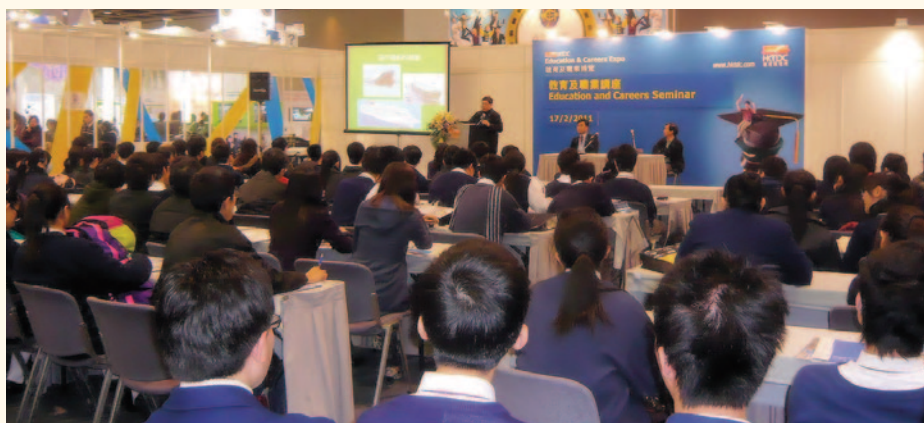
「加入航運業的途徑與發展」研討會。