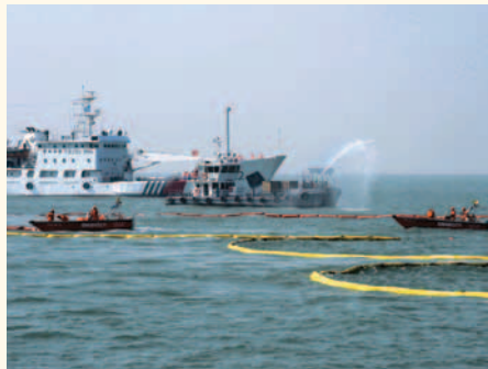
架設圍油欄，防止模擬油污擴散。

香港特別行政區政府海事處 香港中環統一碼頭道38號海港政府大樓 香港郵政信箱4155號 查詢電話：(852) 2542 3711 傳真：(852) 2541 7194, 2544 9241 網址：www.mardep.gov.hk 電郵：mdenquiry@mardep.gov.hk