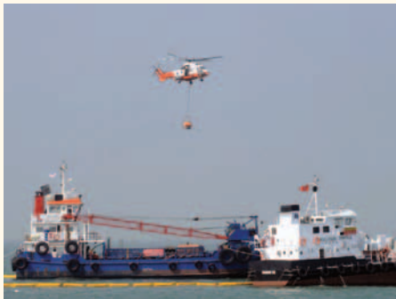
政府飛行服務隊直升機模擬噴灑化油劑。