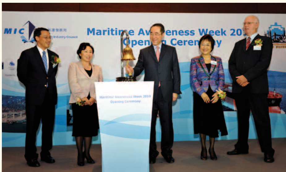
唐英年 (中) 主持香港航運周開幕儀式，其旁 (左起) 為香港船東會主席顧建綱、運輸及房屋局局長鄭汝樺、立法會議員劉健儀和海事處處長譚百樂。