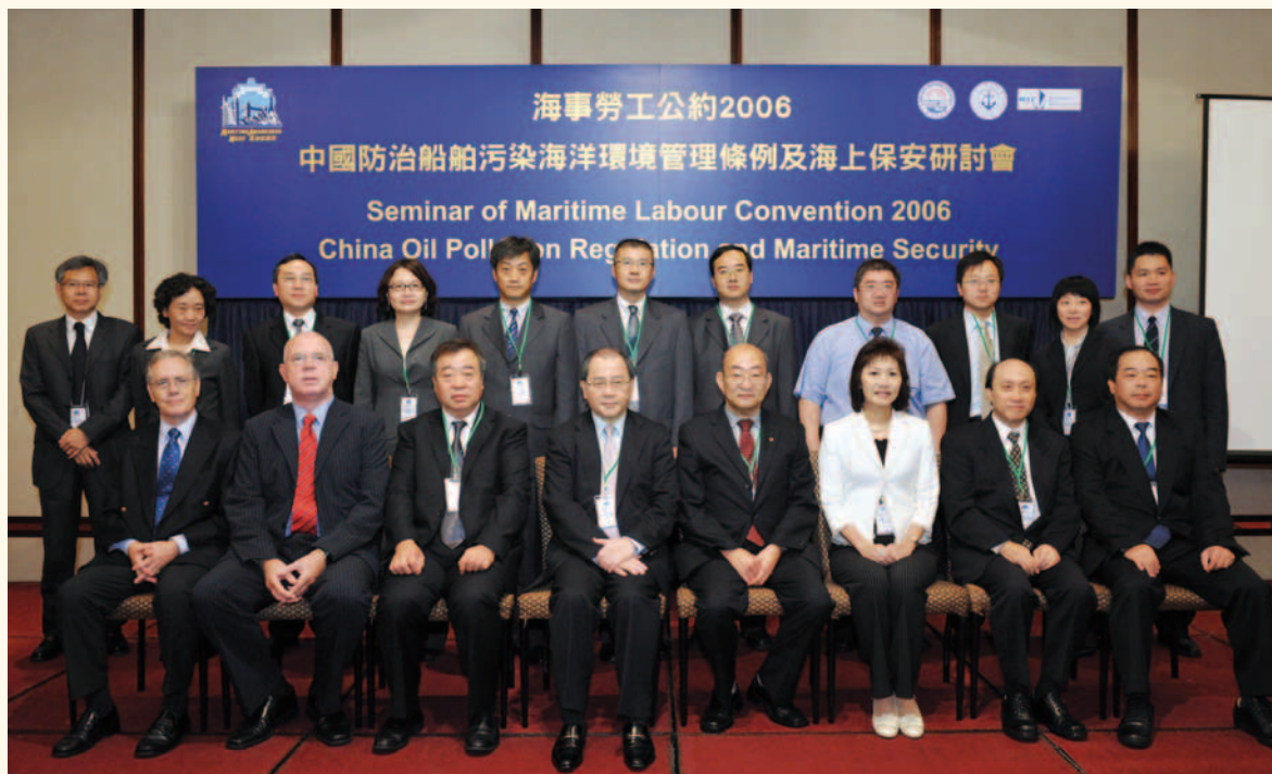
研討會籌辦機構代表和講者合照。