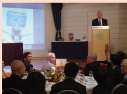
慈善拍賣反應熱烈。