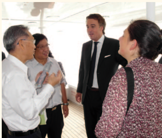
荷蘭交通、工務及水務管理部部长 Camiel Eurlings（右二）率領政府及商務代表團訪港，在「天后」號上聽取海事處人員介紹香港港口的運作。