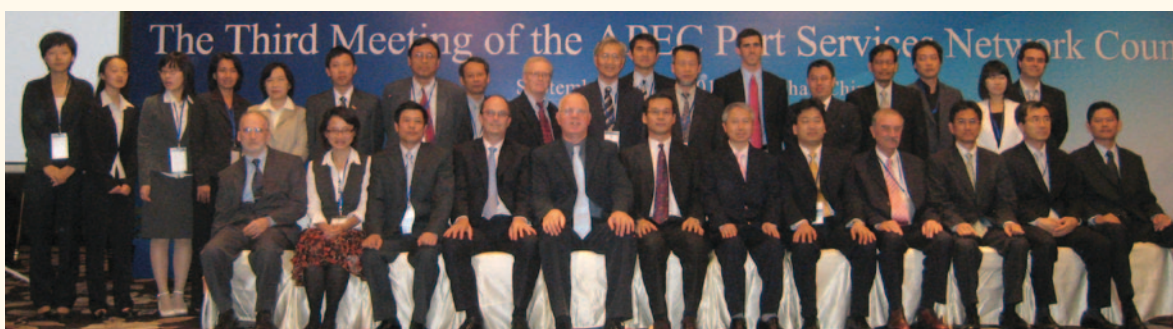
「亞太經合組織港口服務網絡」理事會成員合照。