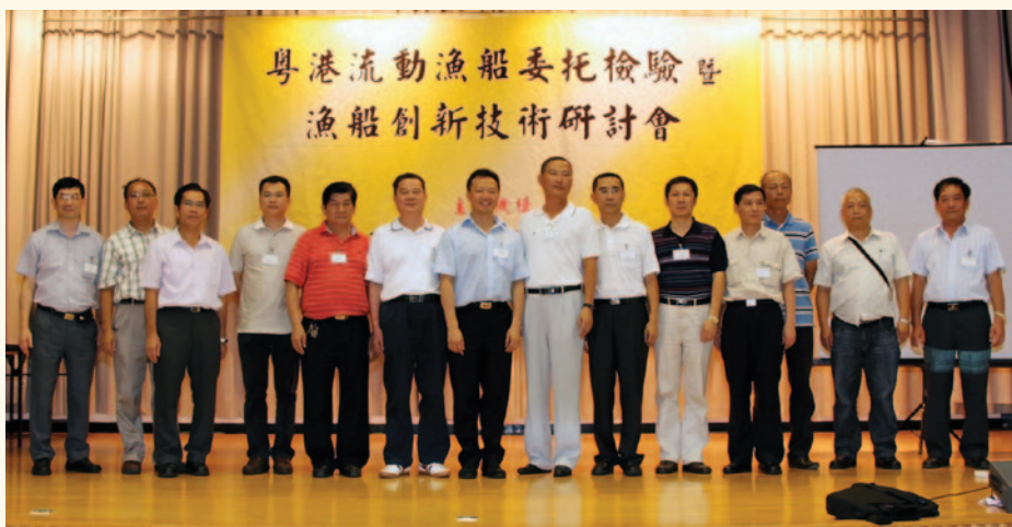
2010年休漁期研討會與會代表合照。