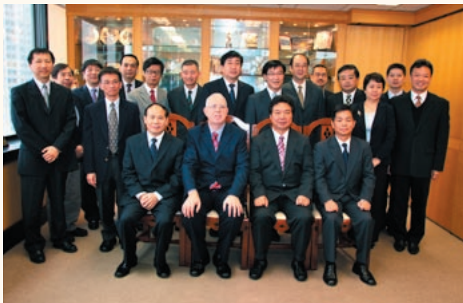
海事處與中國海事局官員於定期會議後合照。