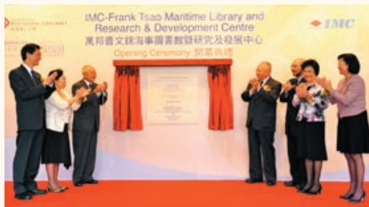
以曹文錦博士命名的香港理工大學海事圖書館暨研究及發展中心揭幕。