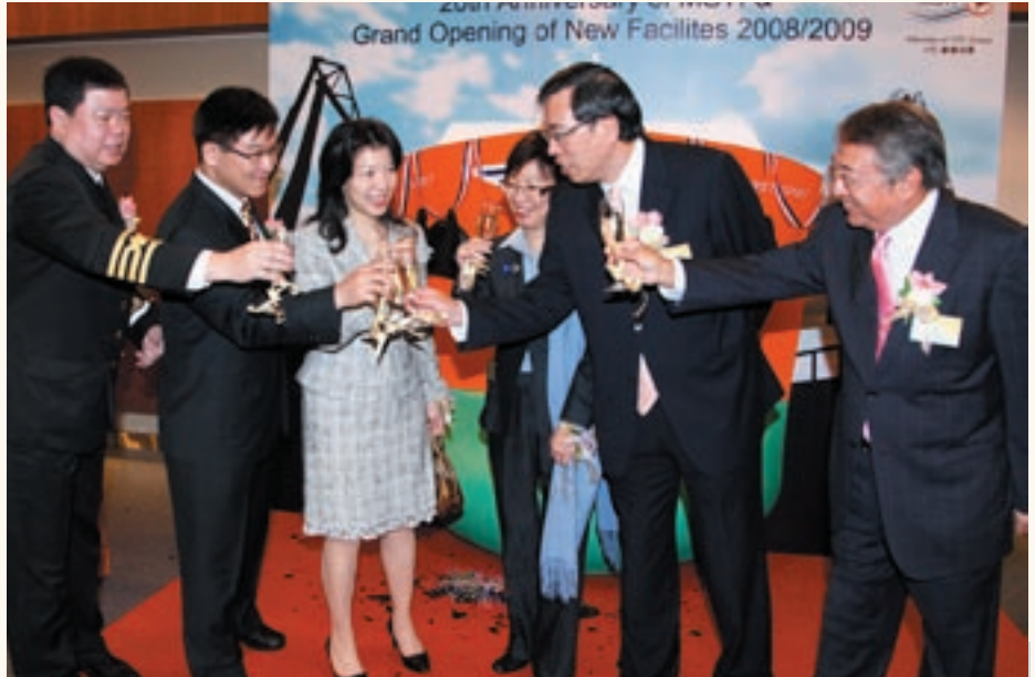
海事訓練學院二十周年暨新設施開幕典禮。

航海獎勵計劃推出以來，已吸引一百二十名青年參加。在航海獎勵計劃下，至今已有一百一十一名甲板實習生及二十九名輪機實習生完成訓練；四十五名甲板實習生及七名輪機實習生仍在接受訓練。航海業並不只由男士專美，現時已有八名女士參加了航海獎勵計劃。