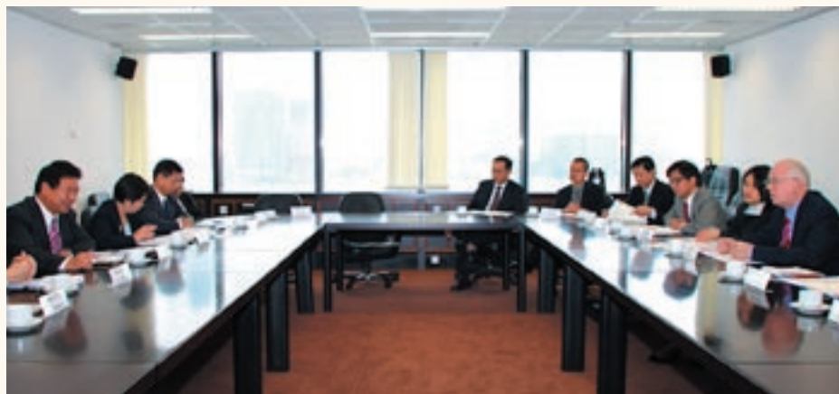
海事處與中國海事局交流意見。