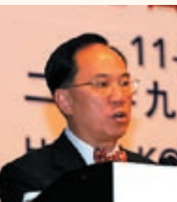
行政長官曾蔭權歡迎與會的國際海事組織的代表。