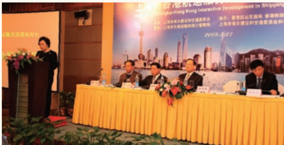
運輸及房屋局局長鄭汝樺在「上海 - 香港航運服務業互動發展研討會」上致辭。