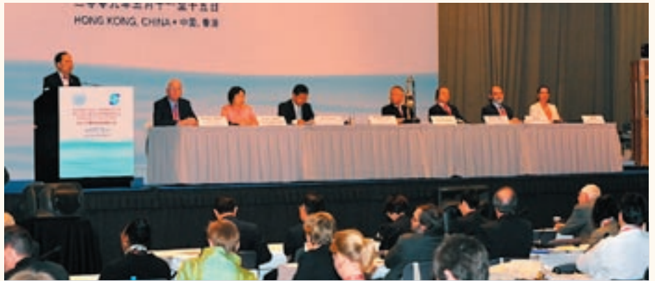
行政長官曾蔭權在大會上致辭。

拆船業僱用數以千計員工，間接為下游行業如航運服務、鋼鐵業、扎鐵廠和熔爐車間帶來就業機會。此外，拆船業也為不少國家的基建和投資項目提供可循環再用的原料。