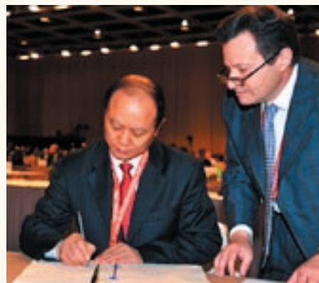
交通部副部長徐祖遠簽署2009年香港國際安全與無害環境拆船公約。

能含有對環境有害的物質，如石棉、重金屬、碳氫化合物、臭氧損耗物等，也關注世界各地船舶拆卸地點的工作和環境狀況。