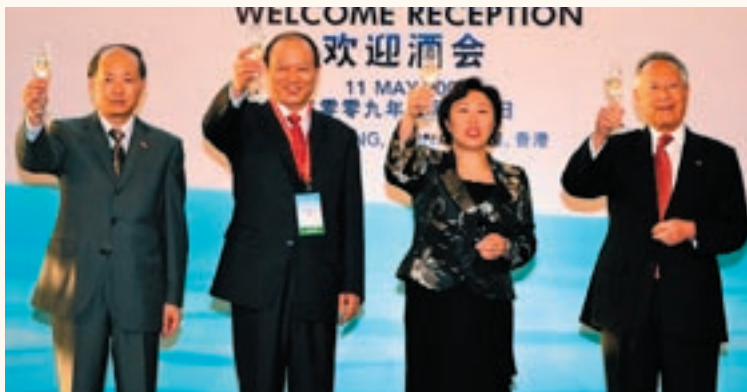
(左起)中華人民共和國外交部駐香港特別行政區特派員公署副特派員詹永新、交通部副部長徐祖遠、運輸及房屋局局長鄭汝權及國際海事組織秘書長米喬普勒斯向與會代表祝酒。