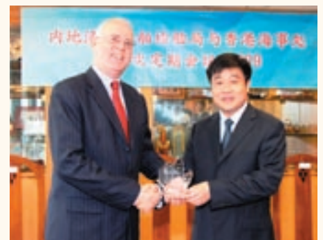
海事處處長譚百樂致送紀念品予國家漁業船舶檢驗局局長周彤。

廣東漁業船舶檢驗局及海事處同意有必要發布有關委託檢驗的指引，以提高委託驗船師的工作效率，並符合海事處所訂的安全檢驗標準。