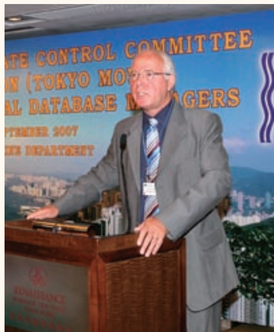
海事處處長譚百樂向東京諒解備忘錄成員致辭