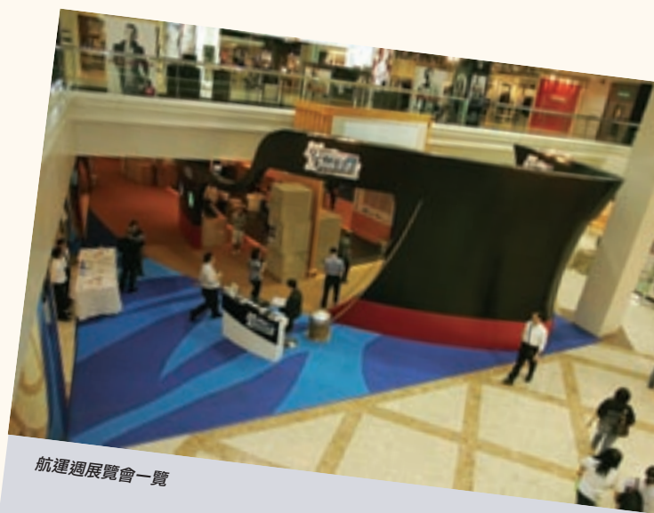
航運週展覽會一覽