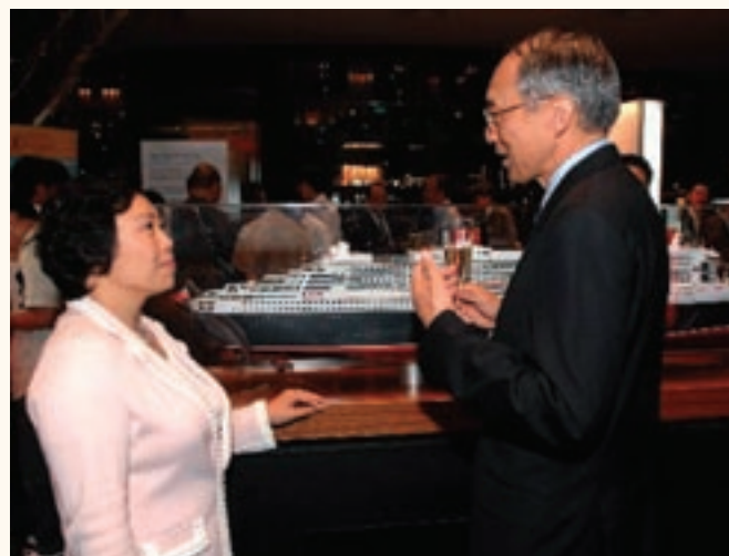
運輸及房屋局局長鄭汝樺與香港海事博物館基金會主席董建成交流意見