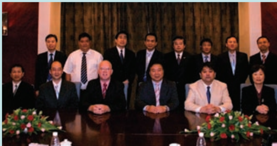
海事處處長譚百樂率領海事處同僚與北京海事局官員舉行會議