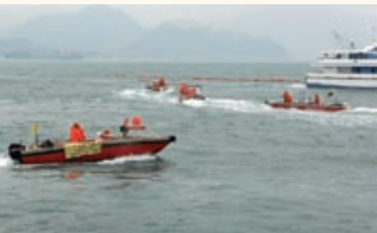
防治海上溢油污染演習的參與者