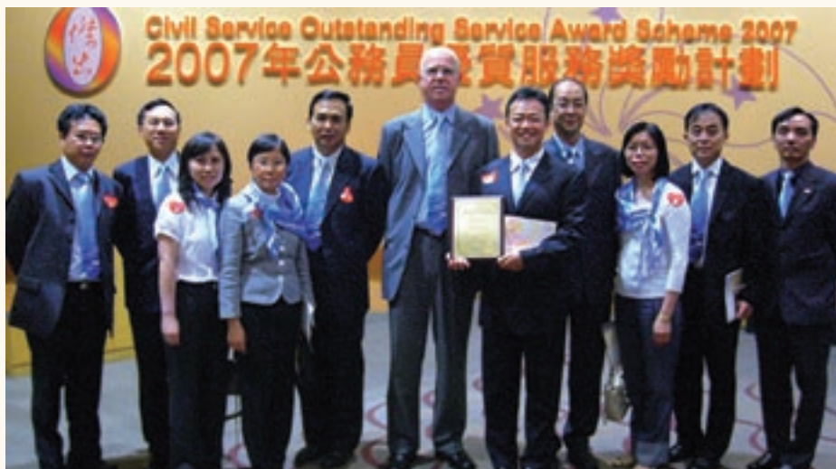
海事處處長譚百樂與註冊處員工在頒獎禮後合照