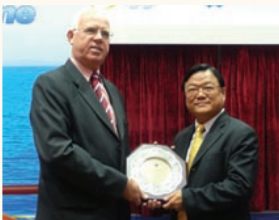
海事處處長譚百樂頒發獎項予東方海外貨櫃航運有限公司，表揚其在香港特別行政區註冊第一艘貨櫃船，並一直留在香港船舶註冊。