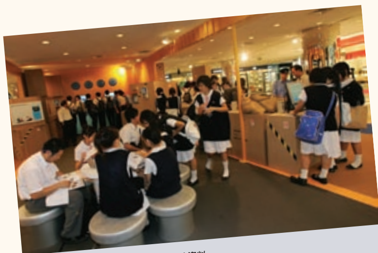
香港學生瀏覽航運週展覽會上陳列的資料