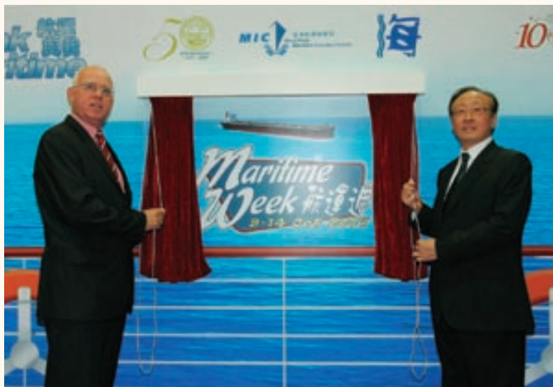
海事處處長譚百樂（左）與香港船東會主席顧建舟主持香港航運週開幕禮