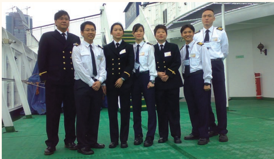
首批完成兩年在職航海訓練的部分年輕學員。