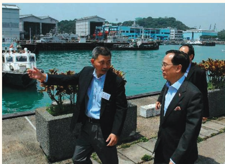
行政長官曾蔭權參觀昂船洲政府船塢。政府船塢設備完善，負責六百多艘大小政府船隻的管理及維修。