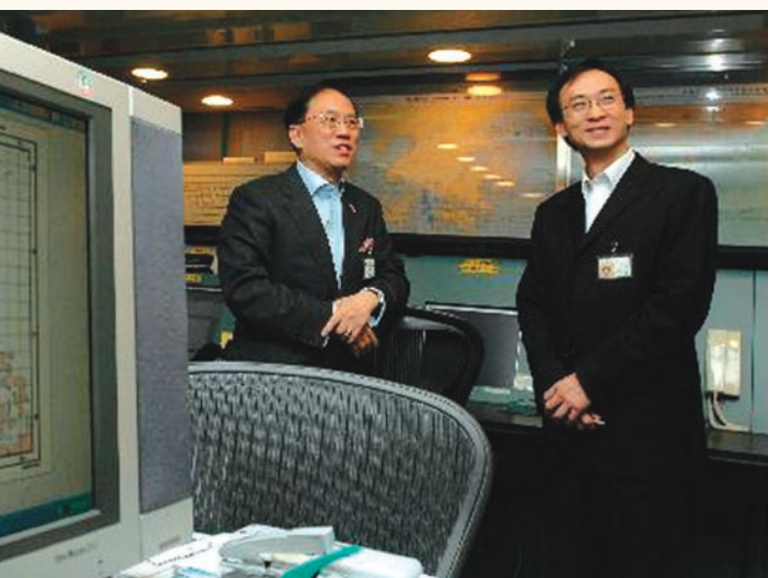
行政長官曾蔭權聽取海上救援協調中心主管介紹中心運作情況。