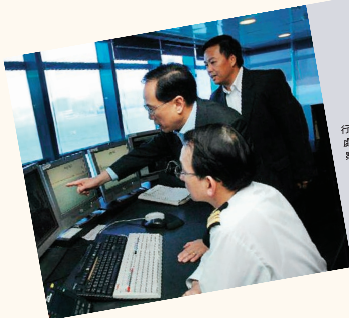
行政長官曾蔭權向海事處人員了解船隻航行監察服務系統的運作。