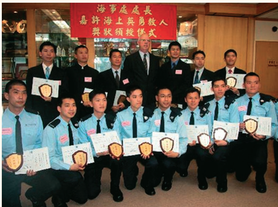
海事處處長譚百樂（站立者中）與21位去年在香港海域救人的勇士合照。