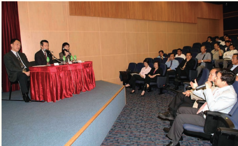
共有超過一百名船艇界人士和水上活動協會會員參加「水上活動安全研討會」，圖示與會者熱烈討論情。