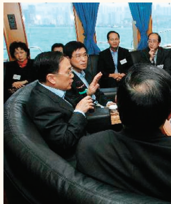
行政長官曾蔭權在「天后」號上聽取香港船舶註冊處的匯報。