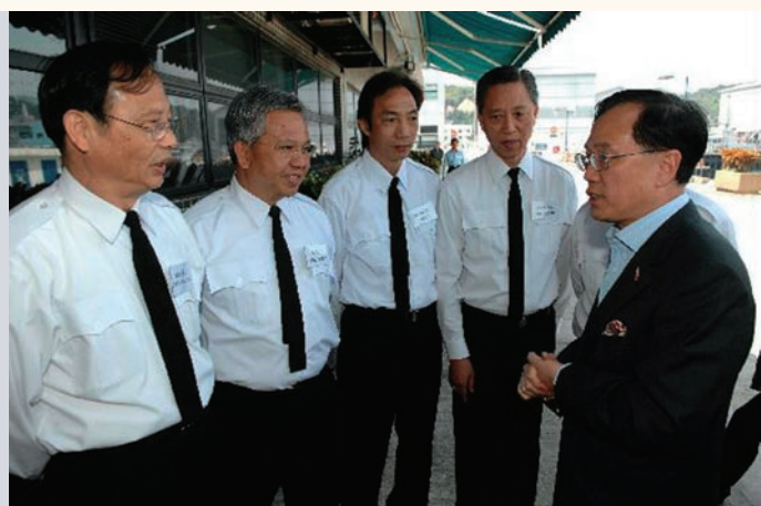
行政長官曾蔭權與昂船洲政府船塢工場的工作人員交談。