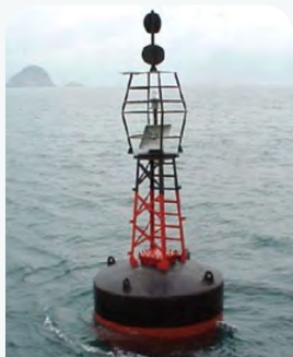
孤立危險物燈浮標