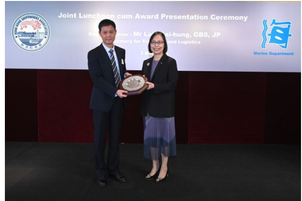
華光船務管理(香港)有限公司獲頒發2022年 港口國監督檢查傑出表現獎