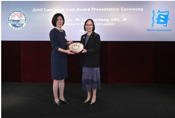
上海海豐船舶管理有限公司獲頒發2022年 港口國監督檢查傑出表現獎