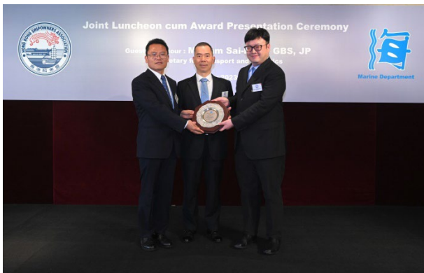
太平洋航運（香港）有限公司代表 “EASTERN CAPE”輪的全體船員獲頒發 2022 年英勇表現獎