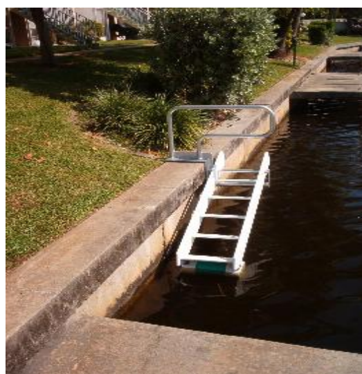
圖 5 — Jason's Cradle