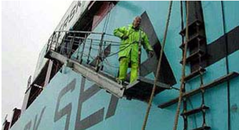
圖 1 — 舷梯及領港員梯